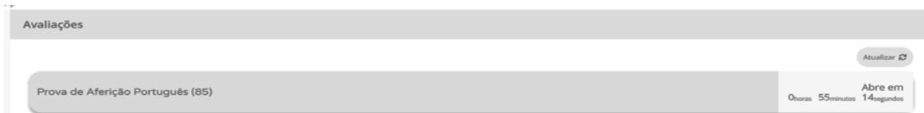
Figura 2 – Acesso à prova a realizar