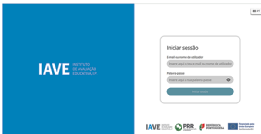
Figura 1 – Acesso à Plataforma de Realização das Provas Eletrónicas do IAVE