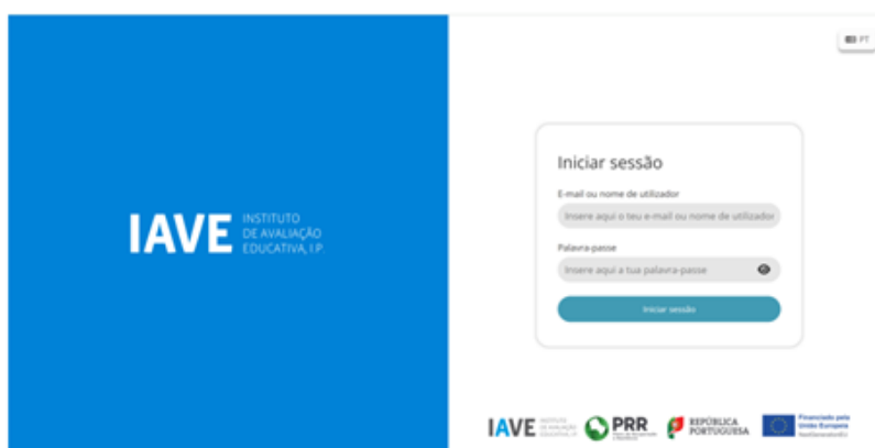
Figura 1 – Acesso à Plataforma de Realização das Provas Eletrónicas do IAVE