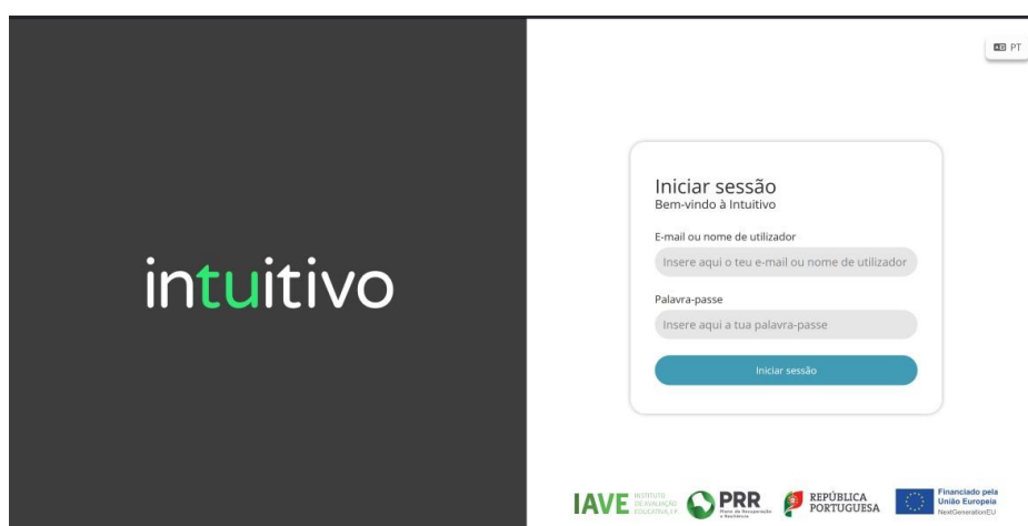
Figura 1 – Acesso à Plataforma das restantes provas