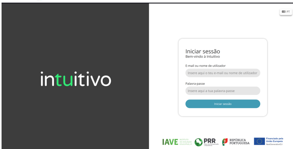
Figura 2 – Acesso à Plataforma das restantes provas